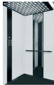
1. D100. Sky. 2. D100. Night. E04